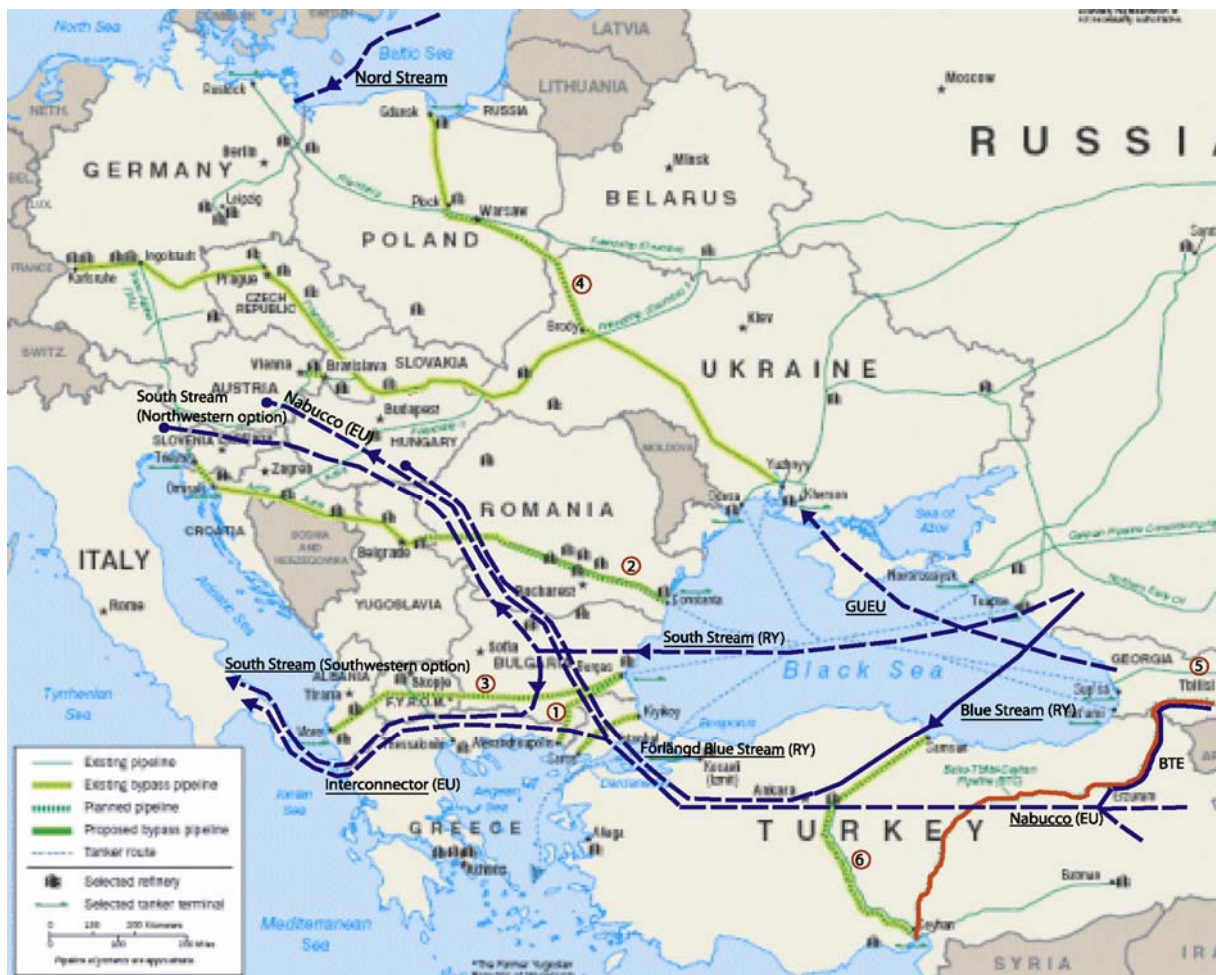
Bearbetad karta av Jens Westlund med underlag från Energy Information Administration (EIA)

Kartan visar befintliga och planerade oljeledningar (gröna linjer, förutom BTC-oljeledningen som är röd). De blåstreckta linjerna visar planerade gasledningar. Heldragna visar befintliga gasledningar.