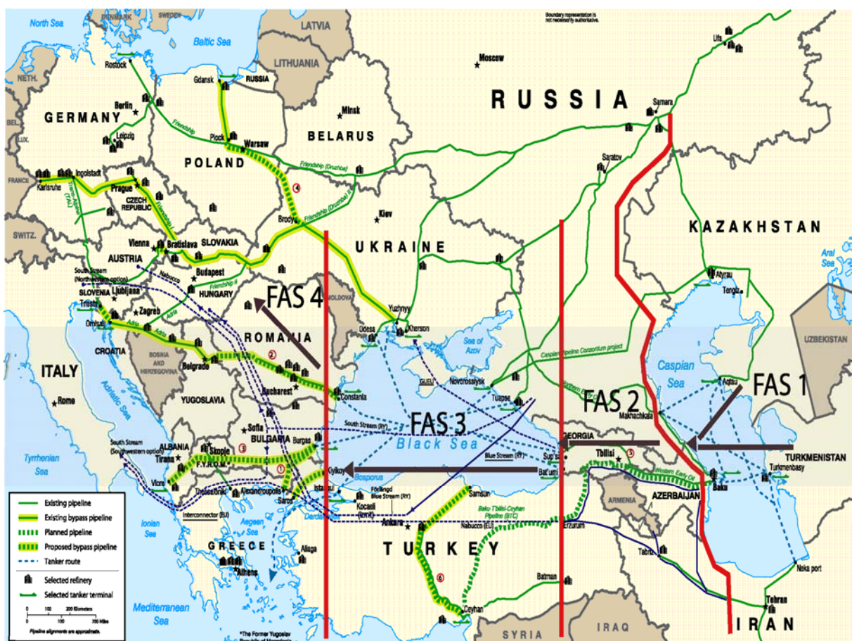
Bearbetad karta av Jens Westlund med underlag från Energy Information Administration (EIA)

Detsamma gäller även för oljedistributionen till EU. Då Bosporen är alltför trångt med hänsyn till de miljökador en stor oljetanker kan ge, och på grund av att Bosporen är mycket hård trafikerad, förs det även en västlig (USA/EU) och östlig (Ryssland) kamp om vem som kan få kontrollen över oljeledningar förbi Bosporen till Medelhavet. Ryssland och det statsägda oljebolaget Transneft har även här ett övertag mot "västliga" energibolag. Ryssland är först med att konstruera en transferledning till Medelhavet utan att passera Bosporen. Så sent som i februari i år kom Ryssland, Bulgarien och Grekland överens om att bygga en oljeledning till hamnen Alexandroupolis i Grekland. Ryssland har även fått Kazakstan att köpa andelar i ledningen och har förbundit sig att exportera olja genom BAP-ledningen från CPC- ledningen mellan Kazakstan och ryska oljehamnen Novorossiysk vid Svarta havet. Även här ligger USA efter Ryssland som ännu inte har påbörjat de projekt som de stödjer. En avgörande faktor för att få ekonomi i konstruktionen av oljeledningarna är långsiktig tillgång på olja. Och där har USA hoppats på att Kazakstan med sina enorma oljekällor skall gynna USA-projekt, vilket ännu inte har skett. USA har sedan 2006 oljeledningen BTC som går direkt till Medelhavet.