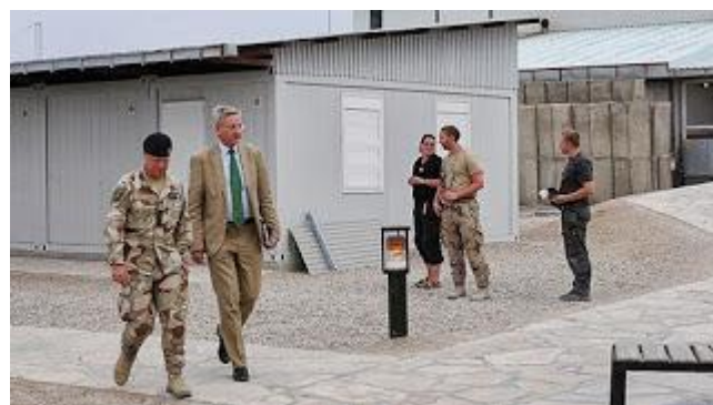
Carl Bildt inspekterar trupperna i Afghanistan. Ska Sverige bli siste man på skansen

Nu kommer dessutom besked om vilka gigantiska summor hemtagningen av krigsmaterielen kommer att kosta. Uzbekistan tar 30 000 euro per container, Ryssland tar 50 000 euro. Sammanlagt har ISAF 100 000 containrar som ska ut, varav minst 500 torde vara svenska. Det skulle innebära en kostnad på mellan 120 miljoner och 200 miljoner kronor. Var ska Carl Bildt och Karin Enström snyta dem? Nalla på biståndsbudgeten som vanligt? På sidan 7 i senaste Afghanistan.nu har jag visat hur regeringen fifflat med kostnaderna för Afghanistankriget. Istället för redovisade 10 miljarder kronor kan den verkliga kostnaden vara 26 miljarder vilket försvarshögkvarteret medgett i brev till mig.