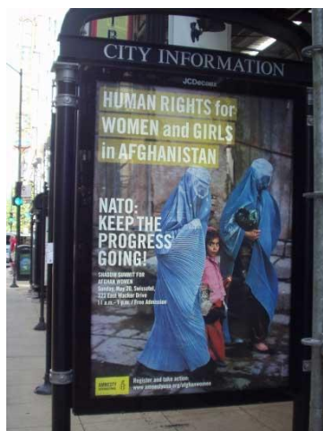
Amnesty Internationals affisch till stöd för USAs krig i Afghanistan

http://stopwar.org.uk/index.php/syria/2448-why-isnt-amnesty-international-opposing-us-escalation-of-the-war-in-syria