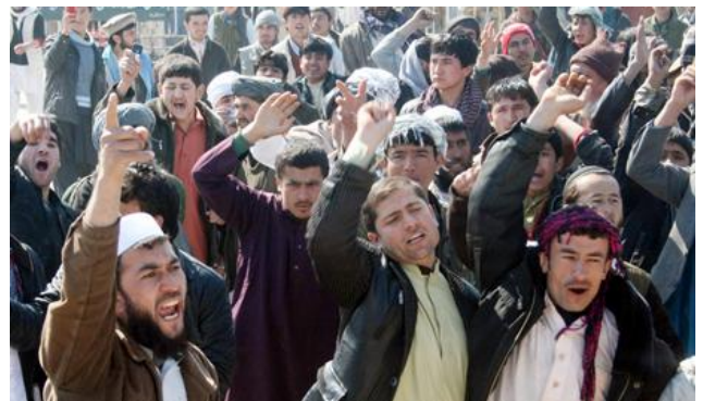
Voice of Russia 21 februari