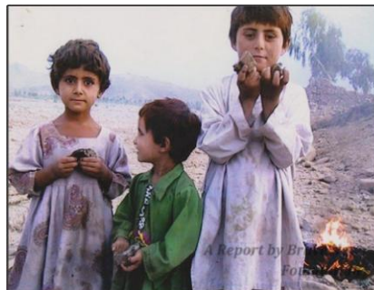
Youth Disrupted: Effects of U.S. Drone Strikes on Children in Targeted Areas

http://www.scribd.com/doc/115147268/Youth-Disrupted-Effects-of-U-S-Drone-Strikes-on-Children-in-Targeted-Areas