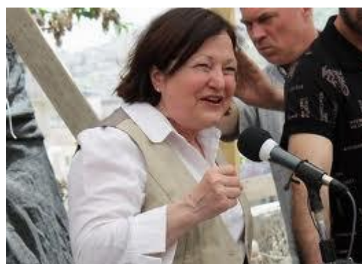
Mairead Maguire, vinnare av 1976 års Nobels fredspris uppmärksammade dagen för internationella

http://www.youtube.com/watch?v=5WsrqgYKhzl